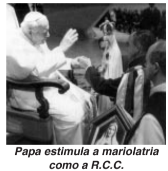
Papa estimula a mariolatria como a R.C.C.

acalmar a animosidade, nada melhor do que o lançamento do filme mariano, "Maria, mãe do Filho de Deus". Notou a leve mudança na forma: "Mãe do Filho e não mais de Deus". Será que a teologia será alterada depois do filme, ou foi apenas um descuido? Provavelmente uma cartada estratégica, pois para a Maria do catolicismo voltar a ser apenas o que ela é na Bíblia, o "papa" teria que anular alguns dogmas e documentos conciliares. Mas tudo é possível para que o ecumenismo possa vingar. Certamente os padres