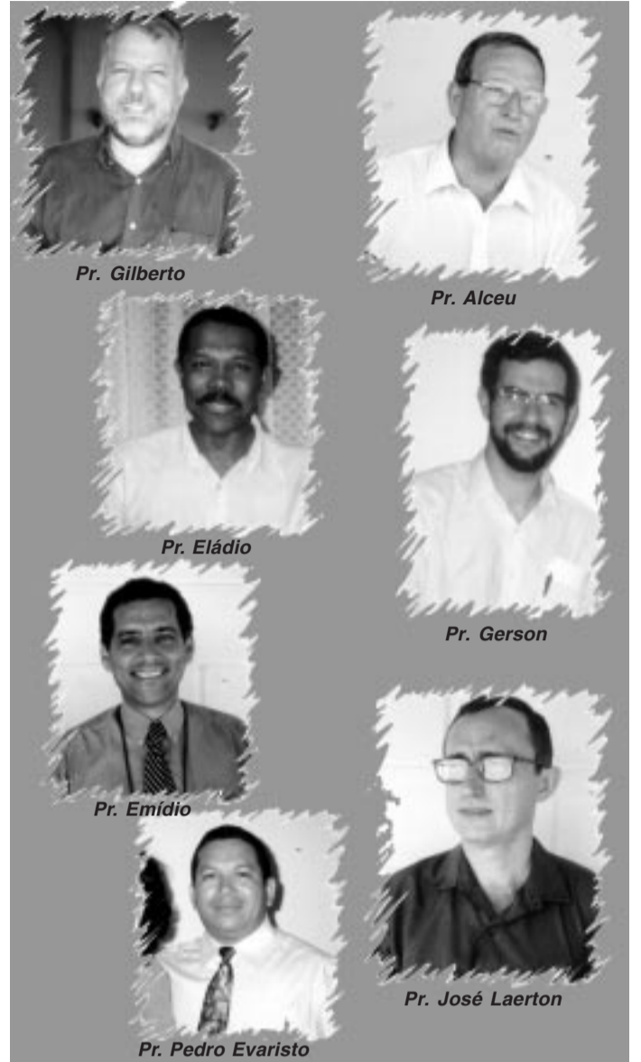
Alguns pastores do Movimento Batista Regular

Nota da Redação: O nome "Regular" vem do latim "Regulare" e significa: "Conforme às leis, às normas, às regras".