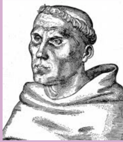
Martinho Lutero - gravura de 1520

No início do século XX, começou outro grande movimento religioso, tanto no meio chamado "evangélico", como no seio do catolicismo romano. Surgiram as igrejas renovadas, ou pentecostais, todas elas dissidentes de outros grupos, mas, principalmente dos Metodistas da América do Norte. Não levou muito tempo até que todas as denominações