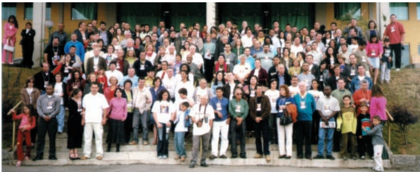
A foto mostra parte dos participantes do Congresso de 2004 realizado em Poços de Caldas-MG.

O mês de outubro de 2004 marcou a vida das pessoas que participaram das duas edições do Congresso Internacional Sobre