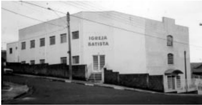
Fachada do Templo Batista Bíblico de Campinas (em acabamento)