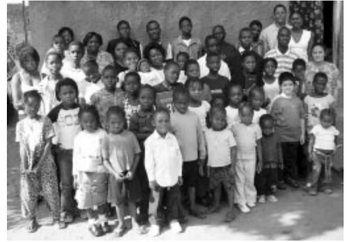
Participantes de um culto em Maputo.