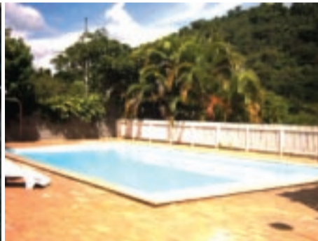
Salão de jogos e piscina

te). O local - encravado no seio na deslumbrante Serra da Moeda - possui capacidade para 120 pessoas, amplo refeitório e capela destinada à realização dos cultos e reuniões.