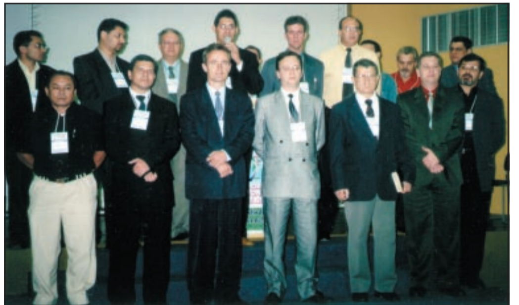
Missionários, conselheiros e diretores da AMI