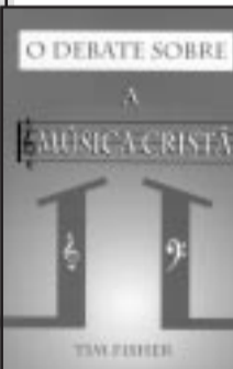
Capa do Livro