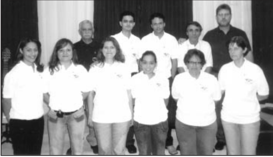
Alunos da primeira turma do SETEFUC

Dois cursos são oferecidos pelo seminário: Licenciatura (3 anos) e Bacharel (4 anos) com grego e hebraico para o Bacharelado. Além disso, haverá cursos extra-curriculares aos sábados. Todas as matérias são ministradas em módulos e com professores qualificados. As aulas vão de segunda a sexta-feira, das 19:30 às 22:30 horas.