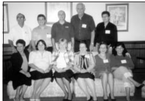
Diretoria da AAI

Para obter maiores informações sobre este ministério, entre em contato pelos endereços: