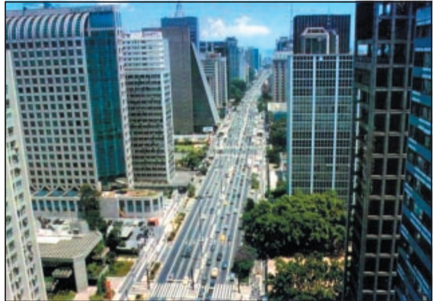
Avenida Paulista - São Paulo-SP