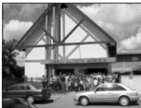
Fachada da IBB em Joinville

abençoando a cidade de Joinville através dos seus múltiplos ministérios: capelania hospitalar em uma maternidade, lar de idosos e grupos familiares espalhados por diversos bairros da cidade.